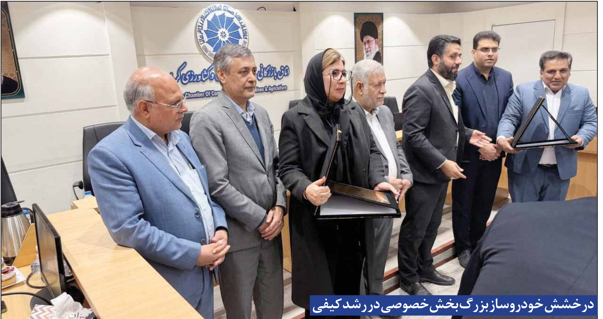
درخشش خودروساز بزرگ بخش خصوصی در رشد کیفی