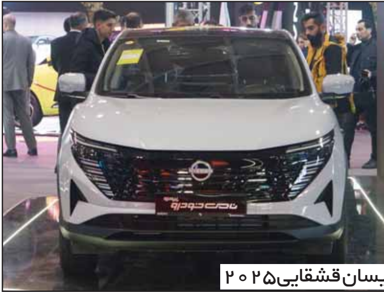
نيسان قشقایی ۲۰۲۵