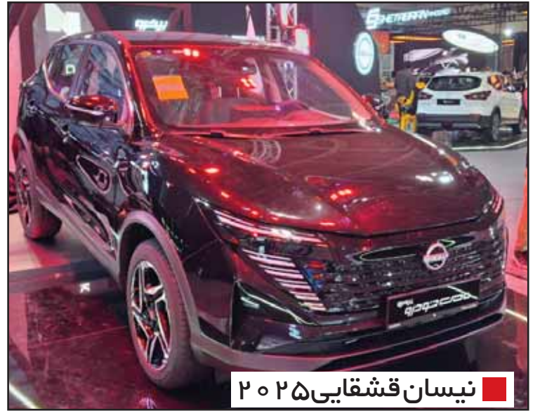
نيسان قشقایی ۲۰۲۵