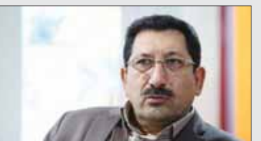
وزیر صمت گفت: بخش عمده‌ای از مشکلات صنعتگران در سال جاری ناشی از ناترازی انرژی است که امیدواریم با بهره‌برداری از طرح‌های جدید، این چالش به‌زودی برطرف شود.

اگر بهره‌برداری آن‌ها تا تابستان آغاز شود، بخش قابل توجهی از ناترازی‌های انرژی برطرف خواهد شد. وزیر صمت تأمین مواد اولیه و تخصیص ارز را یکی دیگر از مشکلات صنعتگران دانست و گفت: در حال حاضر، میزان تخصیص ارز برای تامین مواد اولیه نسبت به سال گذشته افزایش چشمگیری داشته، اما همچنان برخی واحدها با مشکلاتی مواجه هستند که سعی داریم این مشکلات رفع شود.