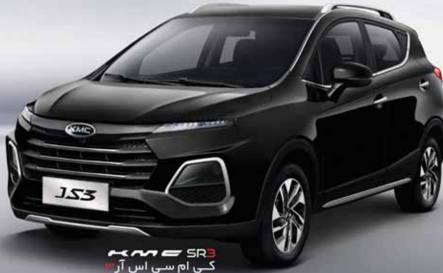
KMC SR3 کی ام سی اس آر