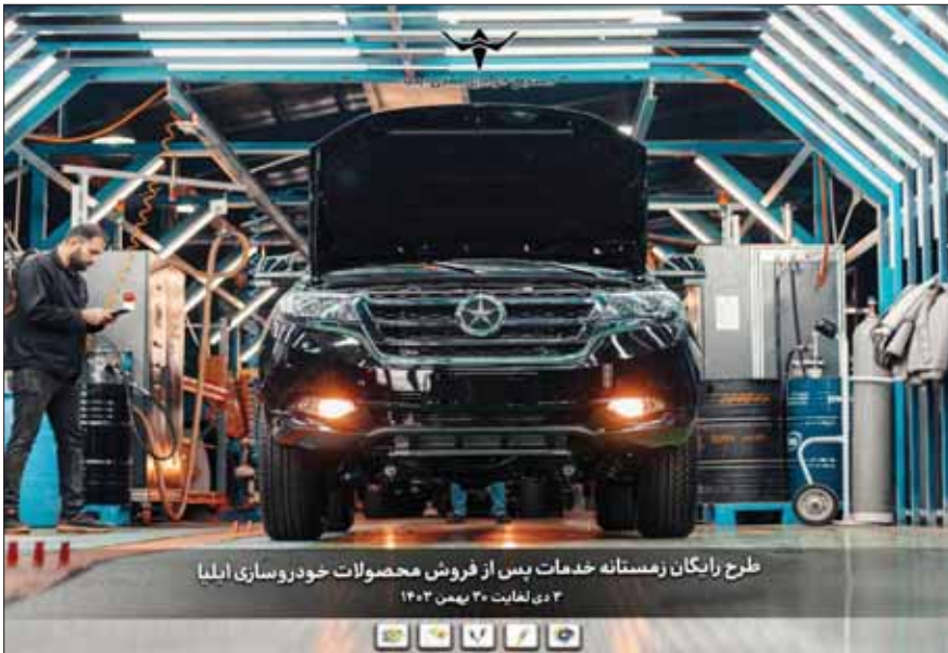
طرح رایگان زمستانه خدمات پس از فروش محصولات خودروسازی ایلیا