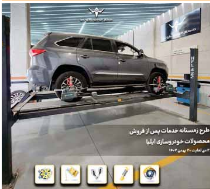
طرح زمستانه خدمات پس از فروش محصولات خودروسازی ایلیا