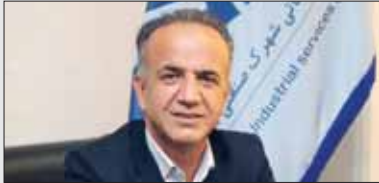
مدیرعامل شرکت خدماتی شهرک صنعتی شمس‌آباد

کامل قطع شد و این وضعیت تا پایان هفته ادامه داشت. مدیرعامل شرکت خدماتی شهرک صنعتی شمس‌آباد با بیان اینکه این موضوع باعث توقف فعالیت واحدهای تولیدی در شهرک شمس‌آباد و سایر شهرک‌های صنعتی کشور شده بود، افزود: بنابراین با این شرایط مشکلات زیادی برای صاحبان صنایع ایجاد شد و نارضایتی‌هایی را