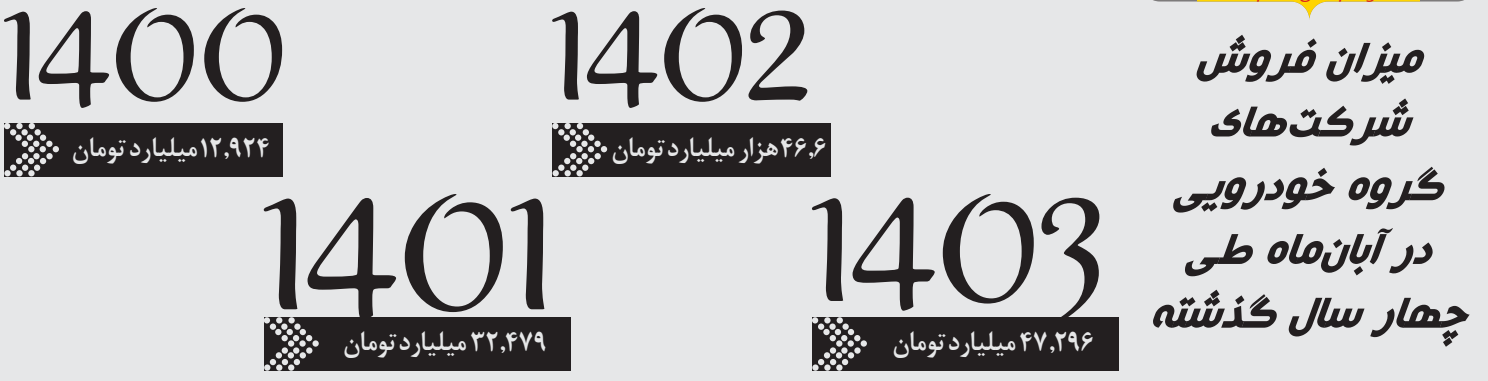
بررسی میزان فروش شرکت‌های خودروساز و قطعه‌ساز بورسی در آبان‌ماه نشان می‌دهد رکورد فروش آن‌ها طی آبان‌ماه سال گذشته افزایشی بوده است