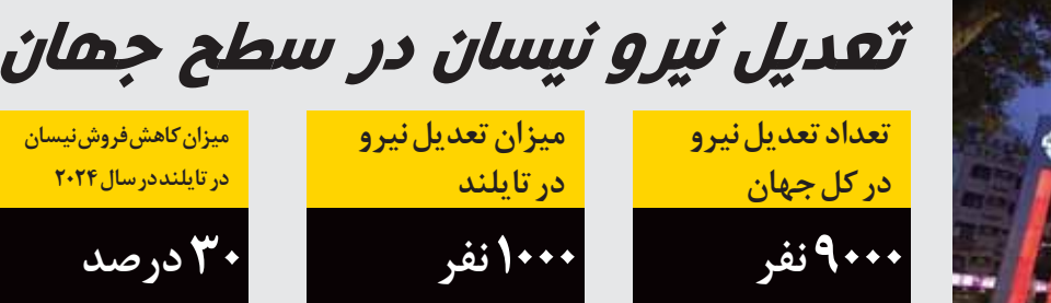
«نپسان موتور» در تایلد حدود یک هزار شغل را حذف یا منتقل خواهد کرد زیرا تولید در جنوب شرق آسیا کاهش می یابد و این بخشی از برنامه کاهش نیروی کار جهانی بوده که اخیراً اعلام شده است