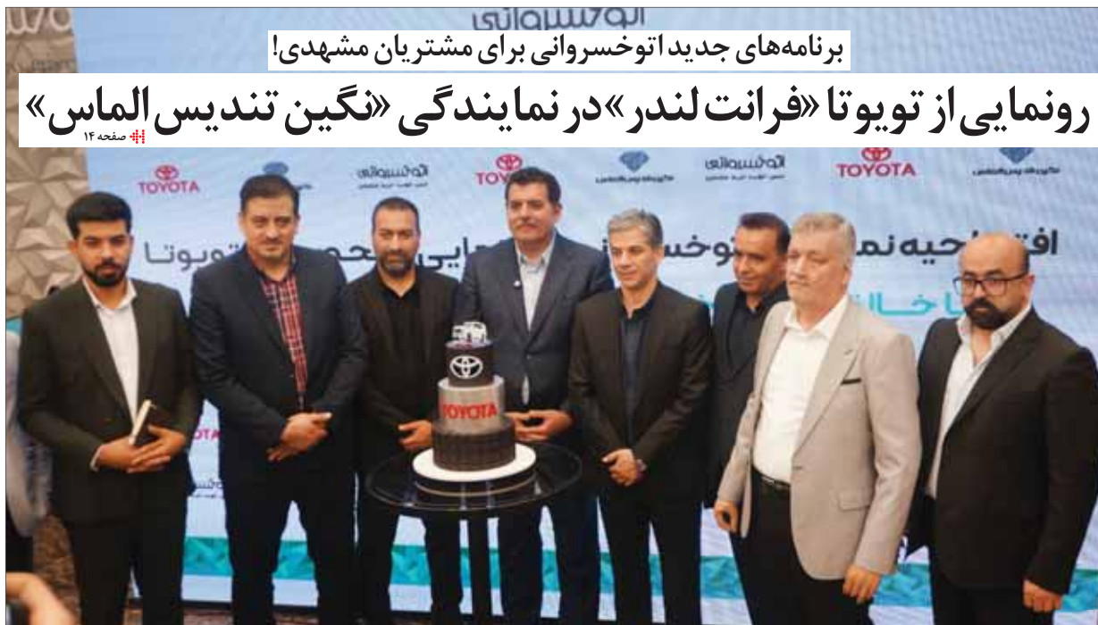
برنامه‌های جدید اتوخسروانی برای مشتریان مشهودی!