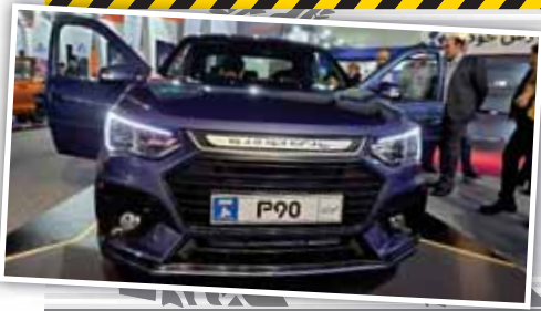
(نسل هفتم گیربکس اتوماتیک DAE) تولید می‌شوند. حال قرار است خودرو P90 پارس خودرو (ال ۱۹۰ ایرانی) نیز با موتور ME16 و همان گیربکس AT به بازار بیاید.