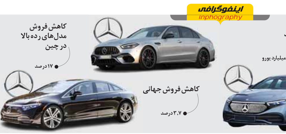
درآمد مرسدس بنز در سه ماهه دوم سال ۲۰۲۴ به دلیل کاهش شدید فروش خودروهای برقی سواری و کاهش تقاضا در چین کاهش یافت. مرسدس بنز به لیست ربه رشد خودروسازانی پیوست که با تقاضای ضعیف تر در چین و کاهش خرید خودروهای باتری دار در اروپا مقابله می کنند

واگذار کرده اند و تا زمانی که اعتماد به بورس ترمیم نشود، نمی توان از تعادل در بورس صحبت کرد. سهامداران باید متقاعد شوند که وارد بازار شوند. تا زمانی که حجم کل معاملات و معاملات خرد در این حد پایین است، نباید انتظار خروج بورس از رکود را داشته باشیم. کارشناسان بورس، اصلی ترین عامل ریزش بازار را بحران انرژی در کشور می دانند. بسیاری از صنایع به علت کمبود برق ساعات و روزهای فعالیت خود را کاهش داده اند. از سوی دیگر بررسی ها نشان می دهد سود خالص ۱۴۹ هزار میلیارد تومانی، صنایع بورسی در اولین فصل