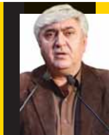
مهدی خطیبی مدیرعامل سابق گروه صنعتی ایران خودرو