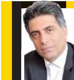
حسن کریمی سنجری نماینده ویژه وزیر صمت در طرح خودروهای برقی