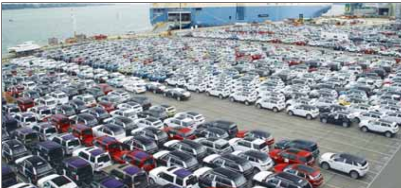
در دیگر کالاهای ممنوع بوده و این موارد در سه تبصره تعریف شده‌است.

وی با اشاره به‌ماده ۴۸ قانون برنامه هفتم توسعه که به قیمت‌گذاری دستوری اشاره دارد، تصریح کرده‌است: «بر اساس این ماده، قیمت‌گذاری دستوری به‌استثنای کالاهای اساسی، یارانه‌ای، کالا و خدمات انحصاری و دولتی