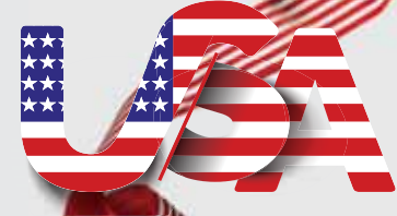
متوسط قیمت خودروهای فروخته شده در بازار آمریکا در سال‌های اخیر را در بالا مشاهده می‌کنید که سیر افزایشی داشته است