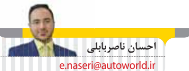
احسان ناصر بابلی

رئیس سازمان توسعه تجارت در پایان گفت: «تمام تلاش خود را انجام می دهیم تا سامانه فروش خودروهای وارداتی و سامانه فروش خودروهای برقی در اردیبهشت ماه، نخستین عرضه سال ۱۴۰۳ را انجام دهند. در عرضه های پیش رو، در کنار عرضه خودروهای قبلی، محصولات جدید توپوتا، هوندا، نیسان و... حضور دارند و در سامانه خودروهای برقی هم محصولات تمام الکتریکی از نشان های معتبر اروپایی و آسیایی به فروش خواهند رسید.» همچنین احتمالاً در دوره جدید فروش خودروهای وارداتی، محصولاتی مانند توپوتا لوین بنزینی، توپوتا لوین هیبرید، هوندا NS1-E، لاماری ایما HEV، هوندا سیتی، نیسان سیلفی و... به فروش می رسند. از طرفی سیاست دستوری دولت برای کنترل قیمت خودرو در مهیسا، در کنار همه عارضه های منتج از قیمت گذاری دستوری، حداقل سبب جلوگیری از افزایش بیشتر قیمت در کف بازار شده است. بنابراین اگر بخواهیم منطقی به داستان قیمت خودرو در بازار نگاه کنیم، باید علت پیشی گرفتن قیمت خودرو نسبت به تورم عمومی سالانه کشور را در دو دسته از دلایل، نخست عوامل اقتصادی و دوم ناترازی عرضه و تقاضای ناشی از ممنوعیت مطلق واردات در دولت دوازدهم، جست و جو کنیم. بررسی این آمارها بیانگر آن است که رفتار حمایت گرایانه دولت ها از صنعت خودرو بدون توجه به امر رقابتی سازی در بازار نمی تواند راهکار درستی برای سوق دادن این صنعت به سمت توسعه باشد. به طور کلی تولیدات خودرو از منظر اقتصادی بستگی به توانایی رقابت در هر بازار دارد. وقتی ارزش های رقابتی از بازار حذف شود، نتیجه آن ناکارآمدی است. بنابراین در سال هایی که واردات خودرو ممنوع بوده، دولت مجبور شده برای غلبه بر ناترازی عرضه و تقاضا، به روش های نامطلوبی نظیر قرعه کشی روی آورد.