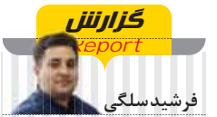
گزارش report فرشید سلگی

روند احتمالا سبب خواهد شد در ۵ سال آینده بخش بزرگی از تولید خودرو به مدل‌های برقی اختصاص پیدا کند. در حالی که نزدیک به ۲۰۰ برند در سطح جهان در حوزه تولید و توزیع باتری برای خودروهای برقی فعال هستند، تنها ۱۶ برند توانسته‌اند تاکنون از ظرفیت ۱۰ گیگاوات-ساعت فراتر روند. همچنین دو غول تولید خودروهای برقی یعنی تسلا و BYD بالاتر از ۱۰۰ گیگاوات-ساعت باتری استفاده کرده‌اند. براساس این گزارش، تسلا ۱۳۲.۱ گیگاوات-ساعت باتری استفاده کرده که ۳۷ درصد بیشتر از یک سال گذشته است. مصرف باتری BYD نیز با توجه به فروش خودروهای بیشتر (۳ میلیون دستگاه) به رقم ۱۰۱.۶ گیگاوات-ساعت (افزایش ۵۱ درصدی نسبت به سال گذشته) رسیده است. البته رشد فروش خودروهای بی‌وای دی به لطف تولید مدل‌های هیبرید-پلاگین حاصل شده که نیمی از تولید آن را شامل می‌شود. شایان ذکر است گروه فولکس واگن نیز با همه برندهای خود در سال ۲۰۲۳ از مصرف ۵۰ گیگاوات-ساعت فراتر رفت؛ بنابراین به نظر می‌رسد سومین گروه خودروسازی برتر در این حوزه باشد.