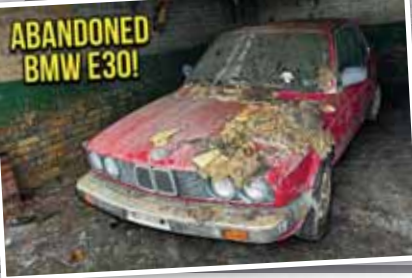
ABANDONED BMW E30!

زنگ زدگی و خوردگی قطعه باعث شکستن آن شده که باعث می شود چرخ عقب سمت چپ سری ۳ در جهت آشنسته قرار گیرد. تیم WD به سختی و با صرف ساعتهای زمان در نهایت سری ۳ نسل E30 را روی تریلر قرار می دهد و البته زمانی که خودرو به مقر شرکت می رسد کارهای زیادی باید انجام شود. رنگ خودرو وضعیت خوبی ندارد و به احتمال زیاد پوشش شفاف آن از بین رفته است. در کابین هم فاصله موش و حشرات دیده می شود. البته یک فرایند دیتیلینگ جامع و کامل خواهد توانست بخش اعظم مشکلات سری ۳ نسل E30 را رفع کند.