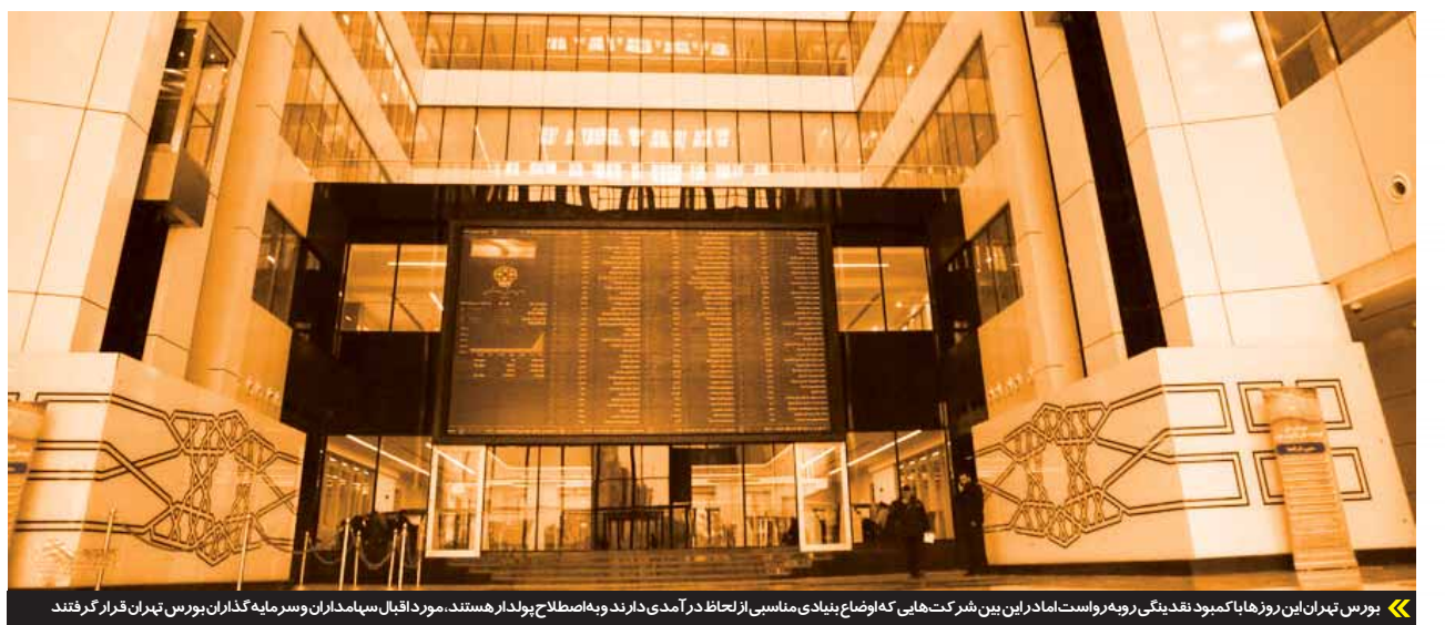
بورس تهران این روزها کمبود نقدینگی روبه رو است اما در این بین شرکت هایی که اوضاع بینداری مناسبی از لحاظ درآمدی دارند و به اصطلاح پولدار هستند. مورد اقبال سهامداران و سرمایه گذاران بورس تهران قرار گرفتند

این ۷ شرکت شامل چهار شرکت خودروساز «ایران خودرو دیزل»، «زامیاد»، «بهمن دیزل» و «تراکتورسازی ایران» و دو قطعه ساز شامل «مهر کام پارس»، «نیرو محرکه» و «گروه صنعتی بارز» (از شرکت های تولیدکننده لاستیک) است