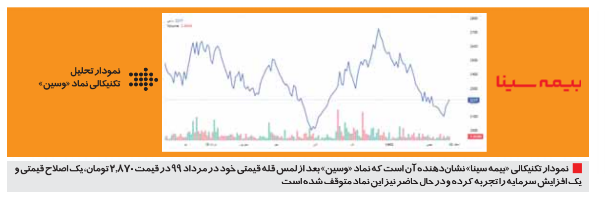
نمودار تکنیکالی «بیمه سینا» نشان‌دهنده آن است که نماد «وسین» بعد از لمس قله قیمتی خود در مرداد ۹۹ در قیمت ۲،۸۷۰ تومان، یک اصلاح قیمتی و یک افزایش سرمایه را تجربه کرده و در حال حاضر نیز این نماد متوقف شده است