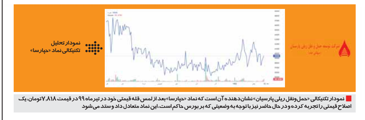
نمودار تکنیکالی «حمل و نقل ریلی پارس‌سیان» نشان‌دهنده آن است که نماد «حبارسا» بعد از لمس قله قیمتی خود در تیرماه ۹۹ در قیمت ۷,۸۱۸ تومان، یک اصلاح قیمتی را تجربه کرده و در حال حاضر نیز با توجه به وضعیتی که بر بورس حاکم است، این نماد متعادل داد و ستد می‌شود