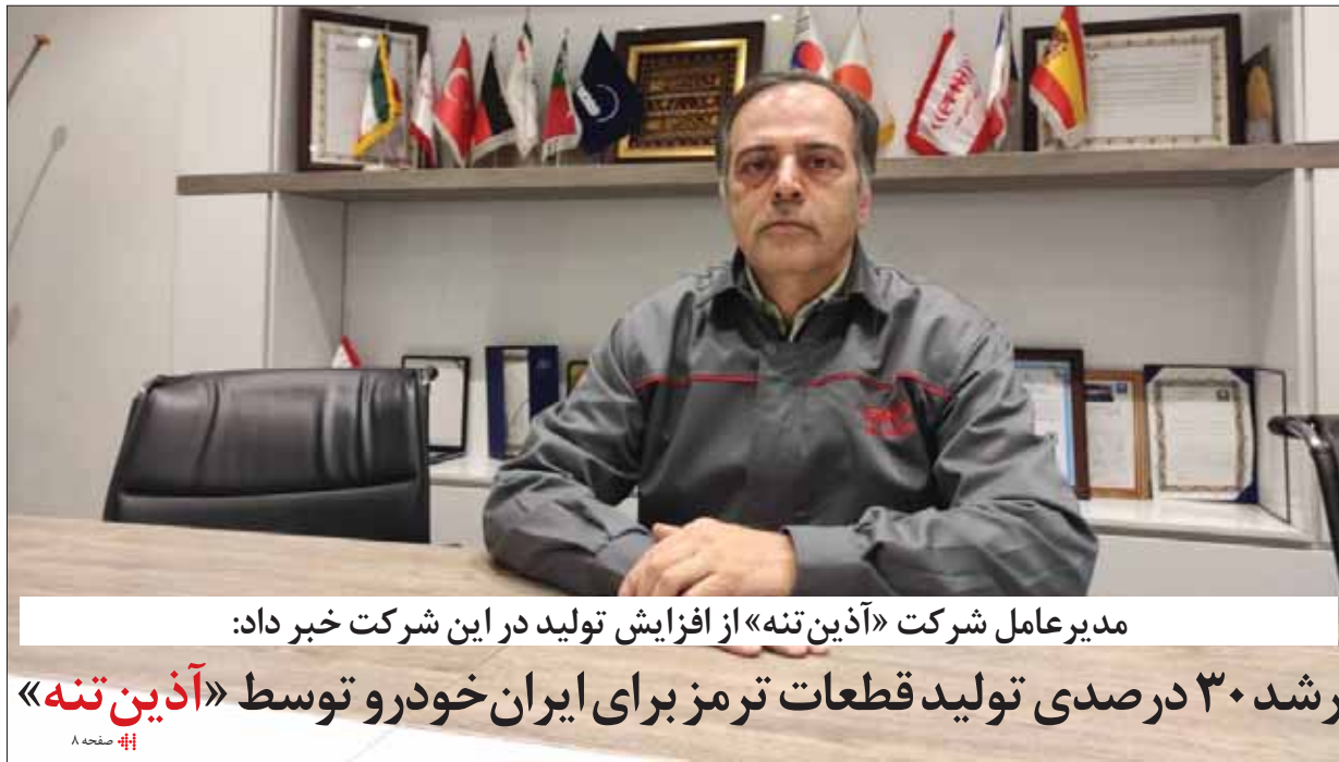
مدیرعامل شرکت «آذین‌تنه» از افزایش تولید در این شرکت خبر داد:

سختگوی شهرداری تهران: برخی خودروسازها اقدام به واردات اتوبوس‌های چینی می‌کنند و از شهرداری تهران... #۱ صفحات ۹