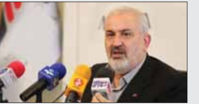
وزیر صمت در جریان نشست خبری

تلفات داریم، وی ادامه داد: علاوه بر این در خودرو برقی که امروز رونمایی شد به ازای هر ۱۰۰ کیلومتر پیمایش تنها ۱۱ کیلو وات ساعت انرژی برقی مصرف می‌شود که هزینه آن حدود ۶۰ سنت است، اما در خودرو بنزینی همین پیمایش حدود ۴ تا ۵ دلار هزینه خواهد داشت. بنابراین باید از این کار حمایت شود در صورت نبود زیرساخت‌ها باید آن رافراهم کرد تا معنی برای توسعه تحقق خودروهای برقی ایجاد نشود.