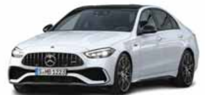
C43 AMG؛ لیدر دنیای چهار سیلندر ها # صفحه ۱۲

عضو کمیسیون صنایع و معادن مجلس شورای اسلامی: واردات خودرو تسریع شود، قیمت بازار شب عید شکسته خواهد شد # صفحه ۴