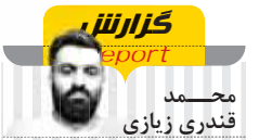
محمد قندری زبازی

اومودا E5، این پرچمدار خودروهای الکتریکی قرار است با بسته باتری پیشرفته لیتیوم- آهن فسفات (LFP) عرضه شود. باتری LFP با ظرفیت ۶۱ کیلووات-ساعت به‌گونه‌ای مهندسی شده است که در مقایسه با باتری‌های لیتیوم-یونی مانند نیکل-کبالت-منگنز هرچه بیشتر سبب تعادل بهینه برد شده و هزینه کمتر را همراه با دوام و پایداری بیشتر ارائه می‌کند. اومودا برای بسته باتری یک گارانتی هشت‌ساله ۱۰۰ هزار مایلی ارائه خواهد کرد. نیکل و کبالت مواد حیاتی هستند که تقاضای بسیار بالایی دارند و تولید آن‌ها پرهزینه است. در مقایسه، مواد درون باتری‌های LFP با ظرفیت‌های تامین ساده‌تر و شفاف‌تر ارزان‌تر تمام می‌شوند. آن‌ها همچنین در برابر شارژ مکرر با قدرت بالا تحمل و عملکرد بهتر و بالاتری دارند. به‌همین دلیل Omoda می‌گوید E5 انتخابی مطلوب و در عین حال قابل دسترس را ارائه می‌دهد. E5 با یک بسته باتری ۶۱ کیلووات-ساعتی LFP و یک موتور تکی که اکسل جلوی هدایت می‌کند، ۲۰۴ اسب‌بخار (۱۵۰ کیلووات) قدرت و ۳۴۰ نیوتون متر گشتاور تولید می‌کند. این ترکیب شتاب چشمگیر صفر تا ۶۲ مایل بر ساعت ۷٫۶ ثانیه‌ای همراه با برد