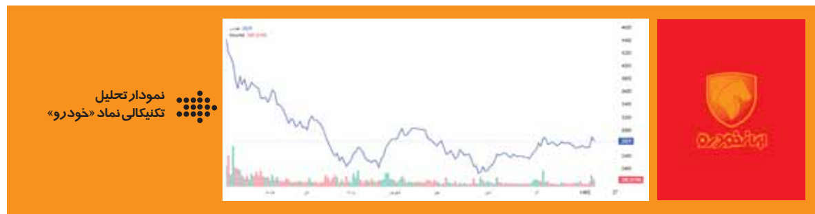
نمودار تکنیکالی «ایران خودرو» نشان دهنده آن است که نماد «خودرو» بعد از لمس قله قیمتی خود در بهمن ماه ۹۸ در قیمت ۱,۲۸۷ تومان، یک اصلاح قیمتی و یک افزایش سرمایه سنگین را تجربه کرده و در حال حاضر نیز با توجه به وضعیت بورس، این نماد متعادل دادوستد می شود