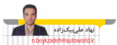
نهاد علی بیگزاده

در حالی که صنعت خودرو به شدت در مشکل زیان‌دهی گرفتار آمده است، خودروهای الکترونیکی کماکان نخستین دغدغه وزیر صمت هستند. به عقیده کارشناسان، ریشه مشکلات امروز این صنعت، در دخالت‌های بالادستی و سیاست‌های تحمیلی به خودروسازان طی چند دهه گذشته است. علی جدی،