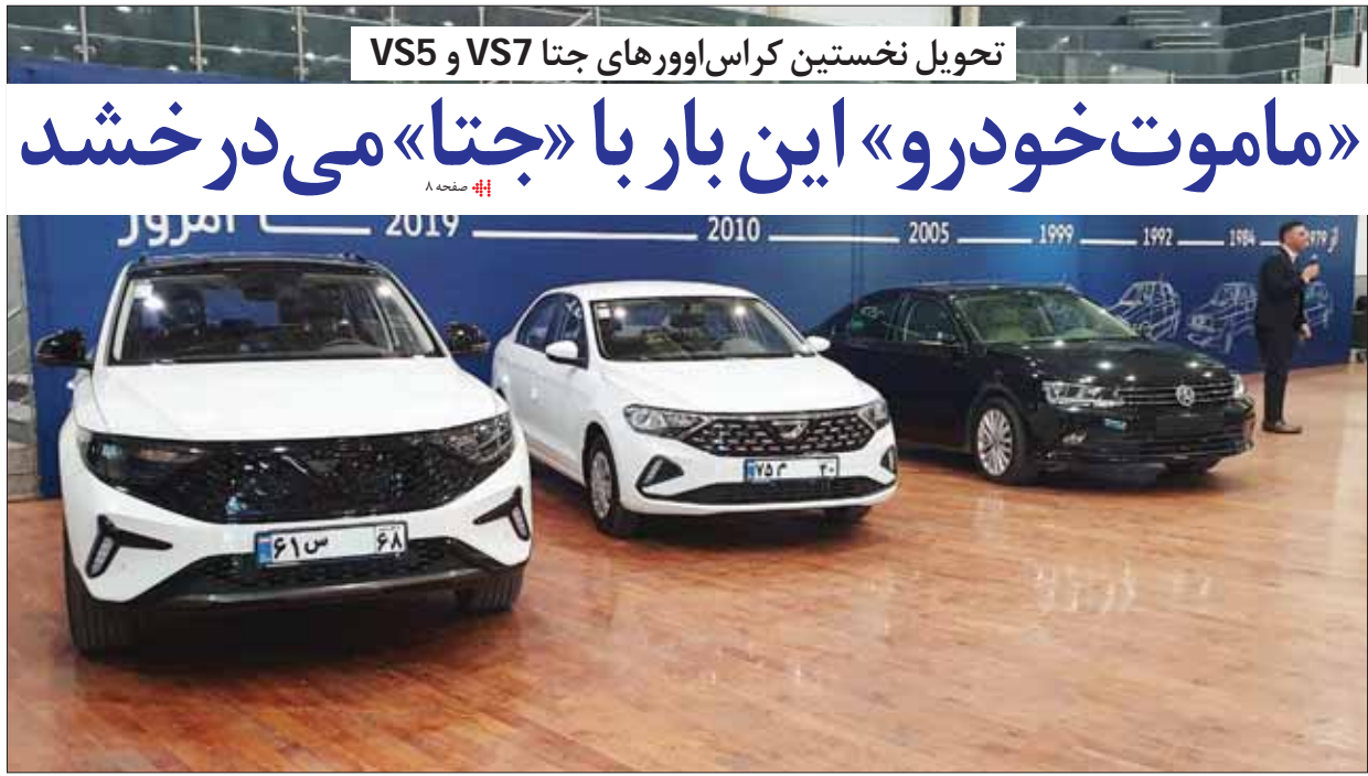
تحويل نخستین کراس اوورهای جتا VS5 و VS7