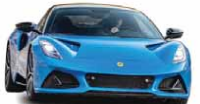
مهندسی مرسدس بنز