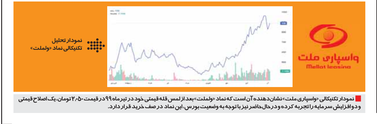
نمودار تکنیکالی «واسپاری ملت» نشان‌دهنده آن است که نماد «ولملت» بعد از لمس قله قیمتی خود در تیرماه ۹۹ در قیمت ۲,۰۵۰ تومان، یک اصلاح قیمتی و دوا افزایش سرمایه را تجربه کرده و در حال حاضر نیز با توجه به وضعیت بورس، این نماد در صف خرید قرار دارد.