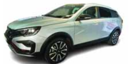
لادا با چهار مدل در ایران استارت زد ۱۰ صفحه

عضو انجمن صنایع همگن قطعه سازی: اقدامی در جهت تسریع پرداخت مطالبات قطعه سازان صورت نگرفته است