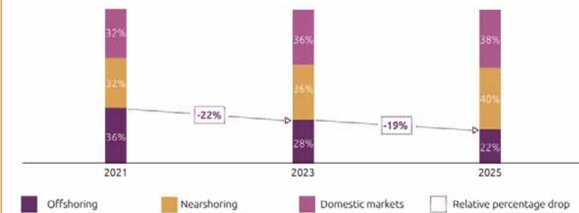
DISTRIBUTION OF PROCUREMENT LOCATION, IN TERMS OF DOLLAR VALUE

Note: Procurement from nearshoring: This involves a business relocating procurement to a geographically nearer country to that currently used. For example, for an organization with final consumers in Western Europe, nearshoring could mean procuring from Eastern Europe, rather than Asia, for example.