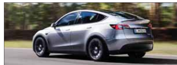
هنگامی که مشخص شد تسلا در واقع خودروهایی با نوعی سلول باتری BYD تولید می‌کند، علاقه طرفداران و کارشناسان را برانگیخت. به‌نظر می‌رسد سلول‌های باتری

تسلا شروع به خرید سلول‌های باتری از BYD کرده‌است و از آن‌ها در کراس‌اورهای مدل Y تولیدشده در آلمان استفاده می‌کند. تسلا و BYD به‌عنوان رقیب یکدیگر در نظر گرفته می‌شوند. اگر چه ایلان ماسک، مدیر عامل این شرکت به‌وضوح گفته‌است که این دو شرکت رقیب، شرایط مثبتی دارند.