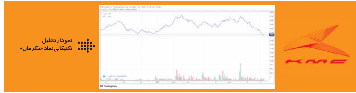
نمودار تکنیکالی «کرمان خودرو» نشان دهنده آن است که نماد «حکمران» بعد از لمس قله قیمتی خود در مرداد ۹۹ در قیمت ۱۰.۲۰۶ تومان، یک اصلاح قیمتی را تجربه کرده و در حال حاضر نیز با توجه به وضعیت کلی بورس، این نماد در صف خرید قرار دارد.