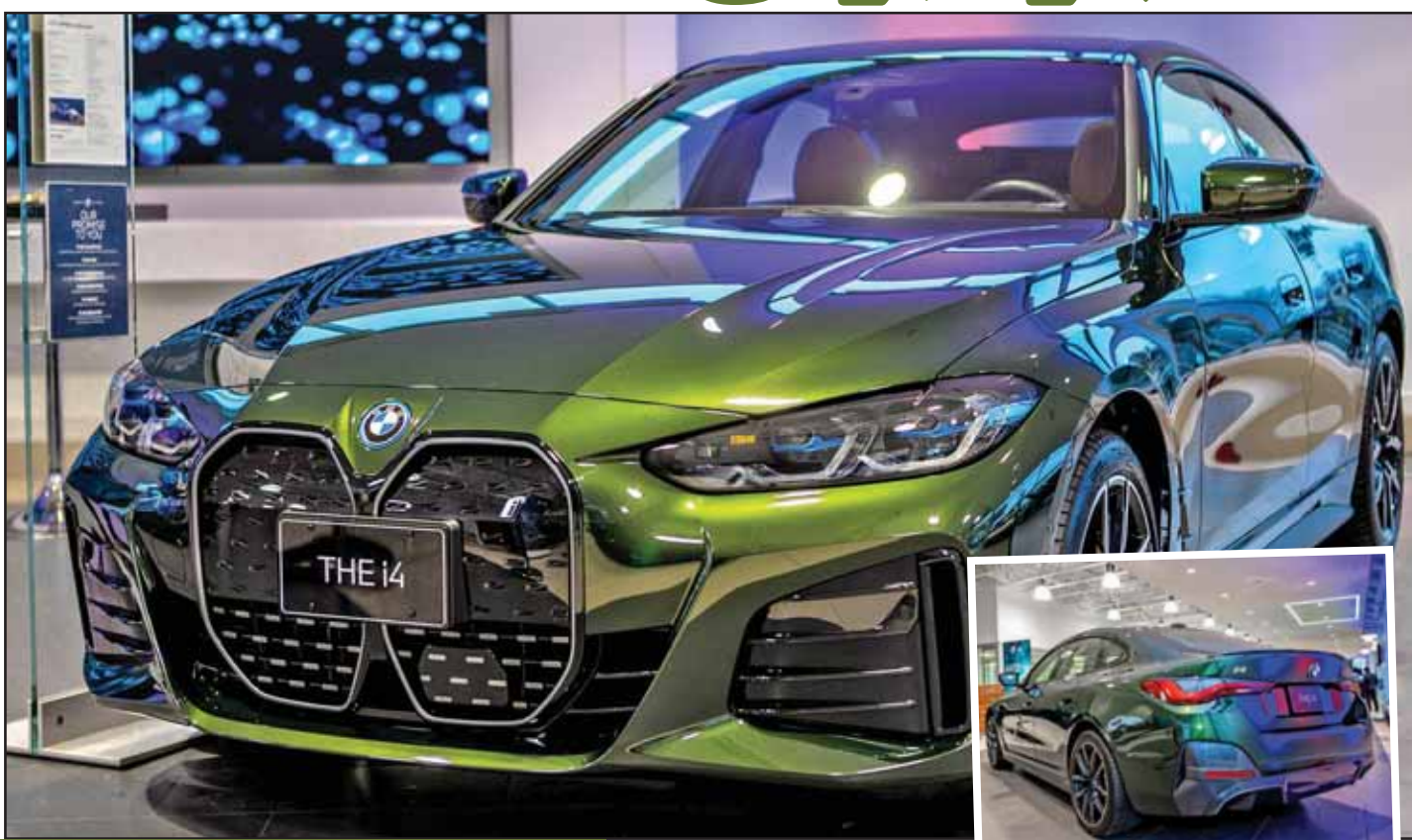
عکس: سائرمو، سائرمو، سائرمو

سائرمو شهری ساحلی در شمال غربی کشور ایتالیا است که یکی از قدیمی‌ترین شهرهای توریستی اروپا محسوب می‌شود. اما این شهر چه ربطی به بامو i4 دارد؟ در میان ۱۲ رنگ قابل سفارش برای i4 یک رنگ سبز خاص به نام San Remo Green وجود دارد که نام آن از همین شهر سائرمو ایتالیا گرفته شده است. این رنگ خاص و سفارشی ۶۵۰ هزار دلار قیمت دارد و در نگاه نخست توجه هر بیننده‌ای را به خود جلب می‌کند. i4 در حالت استاندارد با پکیج ظاهری Sport عرضه می‌شود؛ اما i4 مورد نظر ما به پکیج M Sport مجهز بوده که همین یک حرف M در نام این پکیج ۲ هزار و ۲۰۰ دلار قیمت دارد. علاوه بر سبزی‌های جلو و عقب، گلگیرهای جلو و... شاهد جزئیات مشکی رنگ و رنگ‌های ۱۹ اینچی در کنار صندلی‌های اسپرت در بخش کابین هستیم. تغییراتی که در کنار رنگ سبز خاص i4، اربدل به یک خودرو کاملاً اسپرت کرده که از نظر ظاهری دیگر شبیه به یک خودرو برقی حوصله سر بر نیست.