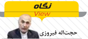
حجت‌اله فیروزی عضو کمیسیون صنایع و معادن مجلس