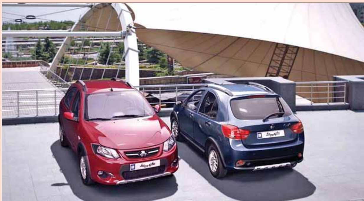
خودرو اتوماتیک بازار است.

کوییک بر اساس استاندارد تست تصادف اروپا با کد ECER127 طراحی شده و زوایای دماغه آن در کنار متر یال استفاده شده در سپر و در موتور امکان پاس کردن این استاندارد را فراهم می کند. در حالی که چنین موضوعی در تیبیا توسعه نیافته است. از طرف دیگر امکان نصب برخی آپشن ها نظیر چراغ روشنایی در روز نیز در کوییک فراهم و اجرایی شده است. کوییک همچنین حدود ۵ سانتی متر ارتفاع بیشتری از برادرانش یعنی تیبیا و سایپا دارد و در بخش فنی از پیشراننده M15 با حداکثر توان ۸۷ اسب بخار و حداکثر گشتاور ۱۲۷ نیوتون متر بهره می برد که در نسخه فیس لیفت «اس» درجه گاز آن از نوع برقی و در نسخه های پایه با گیربکس اتوماتیک نیز درجه گاز به صورت برقی است. کوییک همچنین در بخش امکانات در مقایسه با تیبیا از تهویه مطبوع نیمه اتوماتیک، روفرک، دستگیره آسان باز شو، چراغ روشنایی در روز، آینه جانبی برقی، نمایشگر دمای بیرون، ISO fix و... بهره می برد و در نسخه اتوماتیک پلاس ضمن بهره گیری از گیربکس اتوماتیک CVT به آپشن های ورود و استارت بدون کلید، نمایشگر لمسی ۷ اینچ، کنترل فشار باد تایرها و... نیز مجهز شده است.