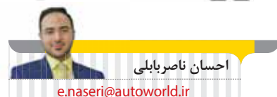
احسان ناصر بابلی