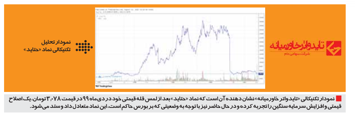
نمودار تکنیکالی «تایدو» نشان دهنده آن است که نماد «حتاید» بعد از لمس قله قیمتی خود در دی ماه ۹۹ در قیمت ۳۰۷۸ تومان، یک اصلاح قیمتی و افزایش سرمایه سنگین را تجربه کرده و در حال حاضر نیز با توجه به وضعیتی که بر بورس حاکم است، این نماد متعادل داد و ستد می شود.