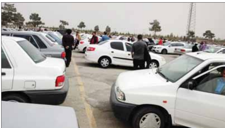
عسکری، نماینده بازرگانی

میلیون تومان، فیدلیتی ۵ نفره با کاهش ۸ میلیون تومان به یک میلیارد و ۲۴۵ میلیون تومان، فیدلیتی هفت نفره با کاهش ۵ میلیون تومانی به یک میلیارد و ۲۸۵ میلیون تومان، جک S3 انوما با کاهش یک میلیون تومانی به ۷۱۲ میلیون تومان و قیمت جک S5 اتومات با کاهش ۵ میلیونی به ۹۵۰ میلیون تومان رسید.