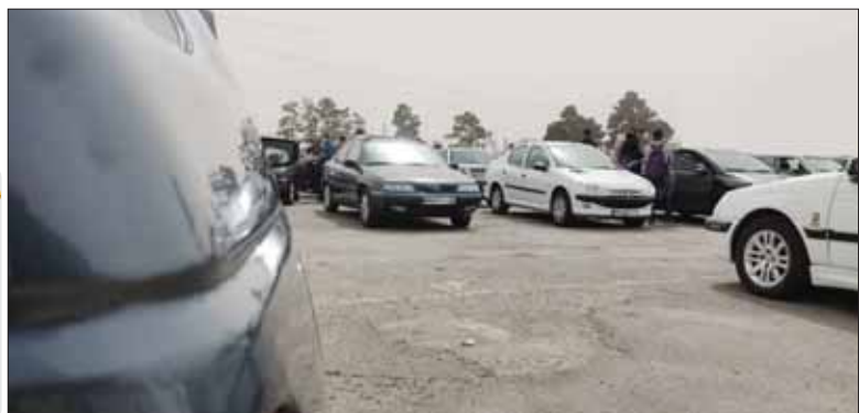
عکس روزانه دنیای خودرو

خودروهای داخلی در نخستین روز هفته کاهش قیمت را تجربه کردند و برخلاف آن چه در هفته گذشته در بازار شاهد آن بودیم، با روند ثابتی در این بخش مواجه شدیم و این در حالی است که باید گفت خودروهای چینی، خارجی پرمیوم و لوکس در نخستین روز هفته با ثبات ترین بازار در چندماه اخیر را تجربه کردند. در نخستین روز هفته، قیمت برخی محصولات داخلی با کاهش ۵۰۰ هزار تومان تا ۲ میلیون تومانی همراه بودند و تعداد خودروهایی که افزایش قیمت داشتند از تعداد انگشتان یک دست نیز کمتر بودند. در این میان اما خودروهای چینی، خارجی پرمیوم و لوکس در بازار بدون تغییر بوده و روز کاملاً با ثباتی را در این گروه ها شاهد بودیم. دلیل اصلی ثبات قیمت خودروهای چینی، خارجی پرمیوم و لوکس را باید خود را از باقیمت ۳۱ هزار و ۵۰۰ تومان دانست. جایی که خودروهای داخلی با کاهش قیمت جزئی در بازار کار خود را آغاز کردند و خودروهای چینی، خارجی پرمیوم و لوکس روزی کاملاً ثابت و بدون تغییر را سپری کردند و بازار با ثبات ترین روز خود را پشت سر گذاشت. گزارش های میدانی خبرنگار «دنیای خودرو» از بیشترین و کمترین تغییرات قیمت در بازار خودرو حکایت از آن دارد که برخی مدل های حاضر در بازار با افزایش قیمت همراه بودند که شامل هایما S7 پلاس با ۱۲ میلیون تومان و وانت آریسان با ۶ میلیون تومان بود. همچنین دیگنیتی با کاهش ۱۵ میلیون تومانی، فیدلیتی هفت نفره با کاهش ۵ میلیون تومانی و مزدا ۳ با کاهش ۵ میلیون تومانی بها در بازار مواجه بودند. مطابق با شماره های قبلی امروز نیز روزنامه «دنیای خودرو» قصد دارد قیمت خودروهای موجود در بازار را که به چهار دسته داخلی، چینی، خارجی های پرمیوم و خارجی های لوکس تقسیم می شوند به تفکیک مورد بررسی قرار دهد.