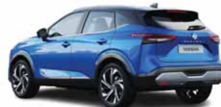
کراس اوور محبوب نپسان با ویژگی های اسپرت