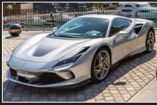
فراری F8 تریبوتو