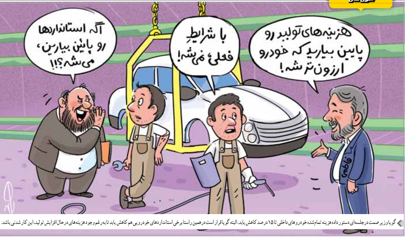
گویا زیر صمت در جلسه‌ای دستور داده هزینه تمام شده خودروهای داخلی تا ۱۵ درصد کاهش یابد. البته گویا قرار است در همین راستا برخی استانداردهای خودرویی هم کاهش یابد تا به رغم وجود هزینه‌های در حال افزایش تولید، این کار شدنی باشد.

آگه استانداردها رو پایین بیارین، می‌شه؟!!