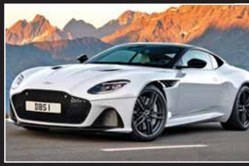
آستون مارتین DBS سوپر لجر