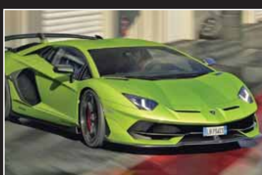
لامبورگینی آونتادور SVJ