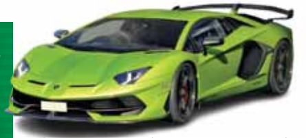
۶ اسپرتی که پر صداترین هستند ۸ صفحه