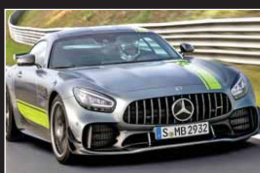
مرسدس بنز AMG GT S

این سوپراسپرت تازه نفس فراری با نام F8 تریبوتو شناخته می‌شود و در زیر چهره کاملاً تهاجمی و تنومند خود یک موتور هشت سیلندر وی‌شکل ۷۱۰ اسب بخار قدرت و ۷۷۰ نیوتون متر گشتاور را به کمک گیربکس هفت سرعته با فناوری F1 به چهار چرخ برساند. این خودرو ظرف ۲.۹ ثانیه از حالت سکون به سرعت ۱۰۰ کیلومتر بر ساعت می‌رسد. اگر F8 تریبوتو را از نزدیک ندیده باشید، می‌توانید با جست‌وجو در گوگل میزان صدای خروجی از پیش‌رانه ۸ سیلندر توپین توربو این سوپراسپرت فراری را بشنوید و آن وقت درمی‌یابید که خروجی‌هایی از جنس تیتانیوم به همراه یک واحد الکترونیکی برای متغیر ساختن زاوای خروجی، صدای حاصل شده از کیت آگروز پرفورمنسی فراری را مشابه یک موتور ۱۲ سیلندر جلوه می‌دهد تا جذابیت F8 تریبوتو را دوچندان کند.