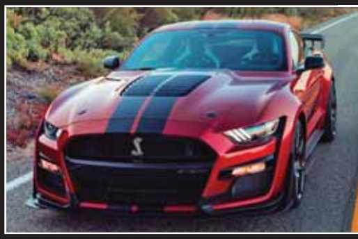
فورد موستانگ شلبی GT500