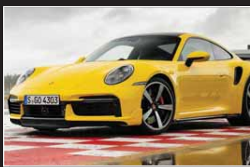
پورشه ۹۱۱ توربو S

اگر چه طراحی استایل زیبا و پیش‌رانه قدرتمند از مهم‌ترین موارد برای جذابیت خودرو به‌شمار می‌رود و در نگاه و تجربه نخست مخاطب را مجذوب خود می‌کند، اما به‌راستی صدای خروجی نیز اگر نگوئیم بیشتر از دو مورد قبل، اما کمتر از آن نیز در جذب مخاطب نقش بازی نمی‌کند