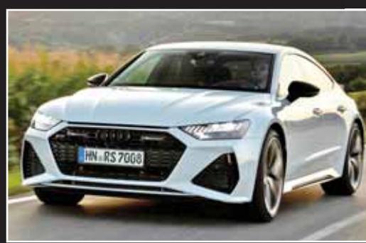
آودوی RS7 اسپرت‌بک