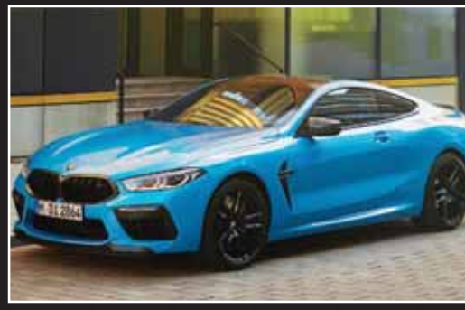
بامو M8 کامپیتیشن