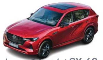
CX-60: نماینده لوکس مزدا ۱۲ صفحه