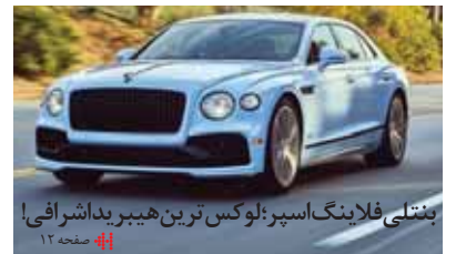
بفتلی فلاینگ اسپر؛ لوکس ترین هیبرید آشنایی! صفحه ۱۲

آیا مصوبه کمیسیون تلفیق بودجه مجلس اجرایی خواهد شد؟