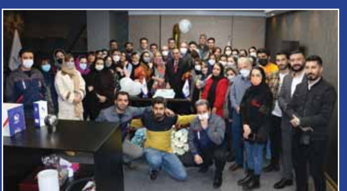
کارمندان شرکت «آما تصمد» در جشن یک سالگی این شرکت