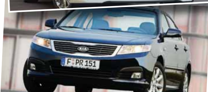
رادر بازار ایران داشت و نزد خریداران جایگاه بسیار بهتری نسبت به هیوندای سوناتا به‌دست آورد.

مشخصات فنی نسل سوم کیا اپتیما: از نسل سوم کیا اپتیما به‌بعد دیگر شاهد پیشرفته شش سیلندر نبودیم و این خودرو با یک پیشرفته چهار سیلندر ۲.۴ لیتری تنفس طبیعی روانه بازار کشور ما شد. این پیشرفته حداکثر قدرت ۱۷۸ اسب‌بخار و حداکثر گشتاور ۲۲۹ نیوتون متر را تولید می‌کند و به یک گیربکس شش سرعته اتوماتیک متصل است. مصرف سوخت ترکیبی کیا اپتیما با این مجموعه فنی برابر با ۸.۱ لیتر در هر صد کیلومتر است و شتاب صفر تا ۱۰۰ و حداکثر سرعت این زیباروی کره‌ای نیز به‌ترتیب برابر با ۱۰ ثانیه و ۲۰۸ کیلومتر بر ساعت است.