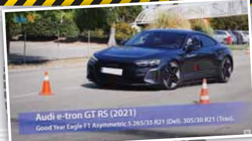
Audi e-tron GT RS (2021) Good Year Eagle F1 Asymmetric 3 265/35 R21 (DHL 305/30 R21 Transil)

از 75 کیلومتر در ساعت ثبت کند. چنانچه بخواهیم مقایسه‌ای بین رکورد RS e-tron GT و دیگر مدل‌ها داشته باشیم، باید گفت این خودرو عملکردی تقریباً مشابه با M4 Competition به نمایش گذاشته؛ البته نماینده باورایی‌ها کمی بهتر ظاهر شده و رکورد 76 کیلومتر را از خود برجای گذاشته است. نکته تامل‌برانگیز اینکه رکورد RSe-tron GT مشاسبه با نسل اول مرسدس بنز A کلاس است، همان نسلی که با عملکرد فاجعه‌بار خود سوایمی بزرگی را برای اشتوتگارتی‌ها به بار آورد.