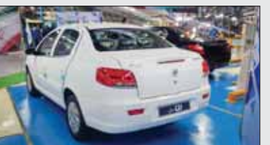
رشد ۸۷ درصدی تولید شش‌ماهه سال ۱۴۰۰ در مقایسه با سال ۹۹

سایپا ۱۵۱ (وانت پراید)، ۹ هزار و ۷۳۳ دستگاه شاهین، ۱۳۰ دستگاه آریو و همچنین ۱۹۵ دستگاه خودروی صادراتی کامل (CBU) و ۹۶۰ دستگاه اس. کی. دی (SKD) با قطعات نیمه‌کامل) بود. این میزان تولید در مقایسه با ۶ ماهه نخست ۹۹ (تولید ۱۶۴ هزار و ۵۸۶ دستگاه خودرو) رشد ۵۳ صدم درصدی نشان می‌دهد. نان‌نچی پوشان جاده‌مخصوص نیز در شهریور ماه ۳۳ هزار و ۷۹۴ دستگاه خودرو تولید کردند.