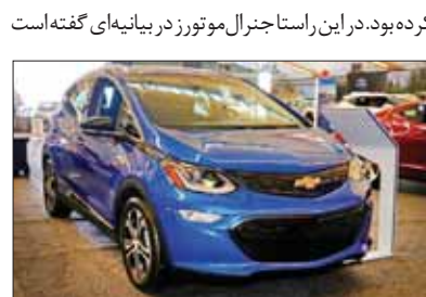
در این مورد آمده است: «جعبه بسته باتری، سیم کشی و سایر اجزای بسته معیوب

نیستند و نیازی به تعویض ندارند. جنرال موتورز همچنین اعلام کرده که باتری‌های این خودرو توسط آل‌جی در کره تولید می‌شوند. بنابه گفته مدیران آل‌جی دو نقص نادر در یک سلول باتری به عنوان علت اصلی آتش‌سوزی در برخی از این خودروها شناسایی شده است. سخنگوی این شرکت می‌گوید: «به‌طور فعال همکاری‌ها ادامه خواهد داشت تا از بدون مشکل بودن باتری‌ها در آینده اطمینان حاصل شود.» بر اساس اعلام شرکت جنرال موتورز چیزی بین ۸۰۰ میلیون تا یک میلیارد دلار هزینه مربوط به فراخوان خودروهای برقی بولت خواهد بود. این خودرو ساز همچنین از مالکان خواسته تا پس از هر بار استفاده، خودرو خود را شارژ کرده و اجازه ندهند تا باتری خودرو به‌طور کامل تخلیه شود. در این صورت خطر آتش‌سوزی کاهش می‌یابد. جنرال موتورز همچنین اعلام کرده که مشتریان نسبت به، به‌روزرسانی خودروها اقدام کنند.