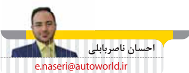
احسان ناصر بابلی