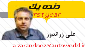
دنده يك 1st gear

آمبولانس‌های معمولی هم داخلی سازی می‌شوند دکتر حسن نوری، معاون فنی و عملیات سازمان اورژانس کشور، در گفت‌وگو با روزنامه «دنیای خودرو» بیان کرد: «اتوبوس آمبولانس‌ها چنددهه متوالی است که در ایران مورد استفاده قرار می‌گیرند. کارایی اتوبوس آمبولانس‌ها به این صورت است که اگر بحران اتفاق بیفتد، تجهیزات و نیروی انسانی سریعاً با اتوبوس آمبولانس به منطقه بحران زده اعزام می‌شوند. این اتوبوس آمبولانس‌ها به دلیل برخورداری