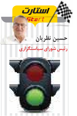
حسین نظریان رئیس شورای سیاستگذاری