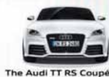
The Audi TT RS Coupé.