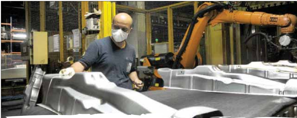
ماد سایپو برای سال ۱۴۰۰ قرار گرفته است.

برنامه ریزی صرفه جویی ارزی مواد اولیه فلزی و غیر فلزی در سال ۱۴۰۰ برای سایپو و زنجیره تامین ایران خودرو، ۲۶ میلیون یورو برآورد شده است که این برنامه در قالب ۲۰ پروژه کلان دنبال می‌شود