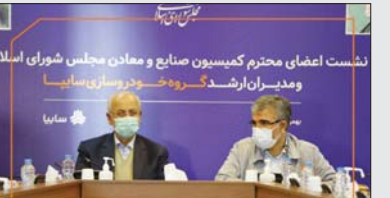
نظمت اعضای محترم کمیسیون صنایع و معادن مجلس شورای اسلامی و مدیران ارشد گروه خودرو و صنایع سایپا

«باتوجه به این نگاه حمایتی، امیدواریم موانعی که بر سر راه تولید خودرو قرار دارد، برداشته شود تا شرکت‌های خودروسازی با تمام توان خود بتوانند تولید و تنوع محصولات خودروهایی را دنبال کنند.» وی ادامه داد: «اعضای کمیسیون صنایع و معادن مجلس نظرات مهمی در حوزه خودرو دارند که مجموعه سایپا تمام تلاش خود را برای تحقق آنها انجام خواهد داد.»