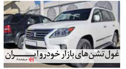
گول‌تشن‌های بازار خودرو ایران

عضو کمیسیون صنایع و معادن مجلس در گفت‌وگو با روزنامه «دنیای خودرو»: سقف تولید امسال خودروسازان حدود ۹۰۰ هزار دستگاه خواهد بود