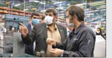
مدیریت بهره‌وری و نظارت بر کیفیت در این شرکت آشنا شدند.

بالغ بر یک‌هزار نفر در این مجموعه به‌کار گرفته شده‌اند و این تفصیل باید برخی کم‌لطفی‌ها از سوی متولیان نسبت به بخش خصوصی برطرف شود.» به‌باور سعادت موضوع بخش خصوصی راویکرده تقویت آن‌ها و برطرف کردن موانع تولید باید در دستور کار متولیان قرار گیرد و قطعه‌سازی کروز برای سایر بخش‌های صنعتی کشور به‌یک الگودر حیطه مدیریت مبتنی تبدیل شود.