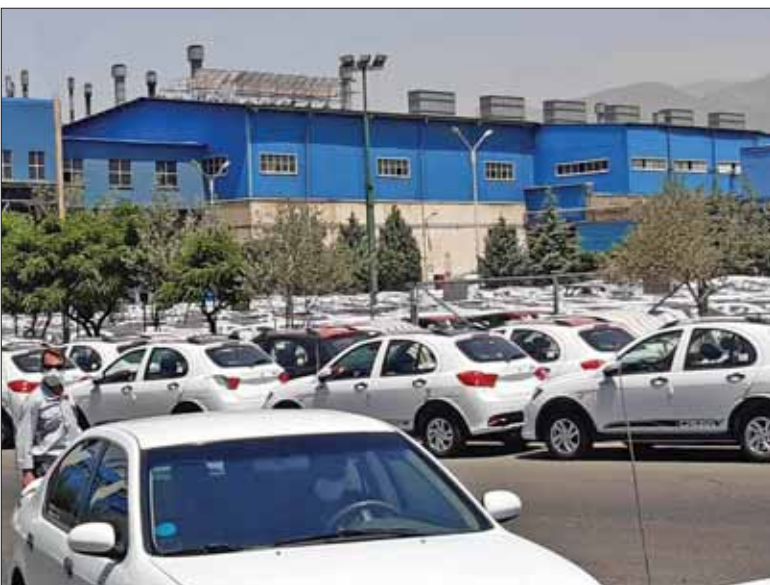
عکس روزنامه «دنیای خودرو»

◀ برنامه فروش و تکمیل وجه ۴۰ هزار دستگاه خودرو قائم مقام مدیرعامل سایپا در امور بازاریابی و فروش همچنین بیان کرد: «با هفته برنامه فروش و تکمیل وجه ۴۰ هزار دستگاه خودرو از محصولات سایپا را در دستور کار داریم که قرعه کشی آن هفته قبل انجام شد.» وی با بیان اینکه این طرح ها برای کنترل التهابات بازار خودرو اجرا می شود، گفت: «همچنین اوایل مهرماه امسال برنامه فروش گسترده ۲۰ هزار دستگاه خودرو را در قالب پیش فروش یکساله اجرا خواهیم کرد، ضمن اینکه با توافقی که میان خودروسازان صورت گرفته است، از مهرماه امسال دو خودروساز بزرگ برنامه عرضه ۲۵ هزار دستگاه خودرو را ماهانه به طور مشترک و به صورت فروش فوق العاده ادامه در همین صفحه